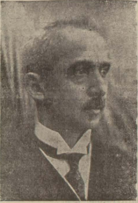
Hatay davamızın başarısını Milli Şef İsmet İnönü

Kırk asırlık Türk yurdunun ana vatanından ayrı kalmıyacağı hakkındaki gür sesin akislerini